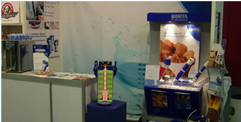
BRITA-Stand in der Kaffeewelt.