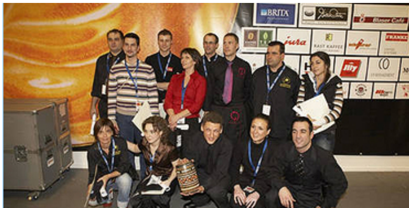
Alle Teilnehmer der Barista-Schweizermeisterschaft