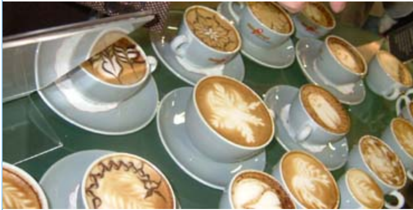
Kaffeekreationen an der Ausstellung